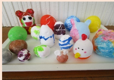
粘土で オリジナル エッグ作り