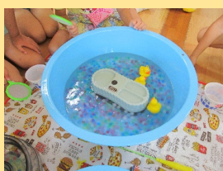
ぷるぷるボールすくい