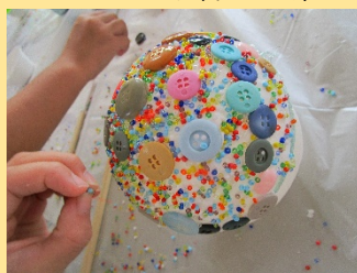
ボタンで小物入れ作り